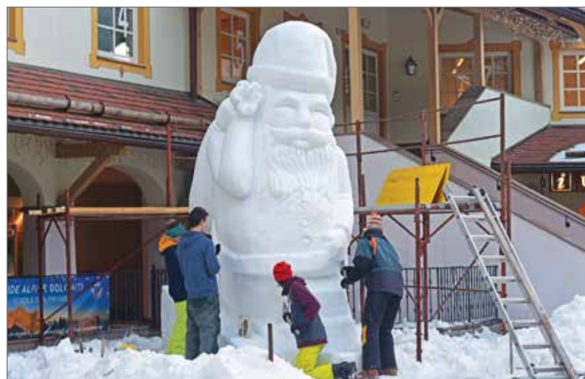
Studenc e professores de la Scola de Fascia al lurier su la statua de neif te Piazza de Comun a Poza.

Per i studenc soraldut l'é stat na esperienza positiva che ge à servi a meter en pratèga i insegnaments fac te clasc, ma ence per etres aspec, desche l lurèr sot i etres e ensema ai etres te na squadra. (vr)