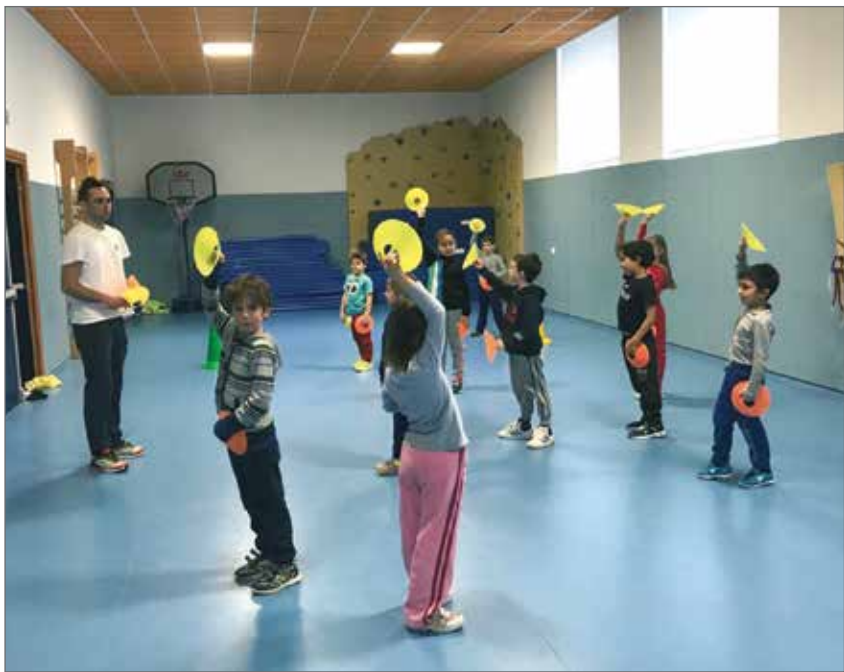
N moment de l'attività motoria con l'espert te la pruma clas de Vich.

L joen espert se disc content de aer l'opportunità de portèr inant chest projec dal moment che l'é apontin per chest che l'ha studià. Ge fazon de bie compliment e ge auguron de cher n davegnir lumenous. (cri.m)